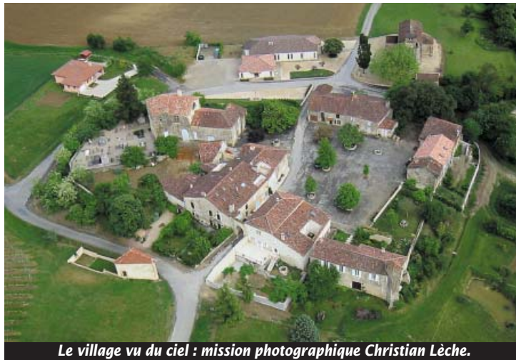
Le village vu du ciel : mission photographique Christian Lèche.