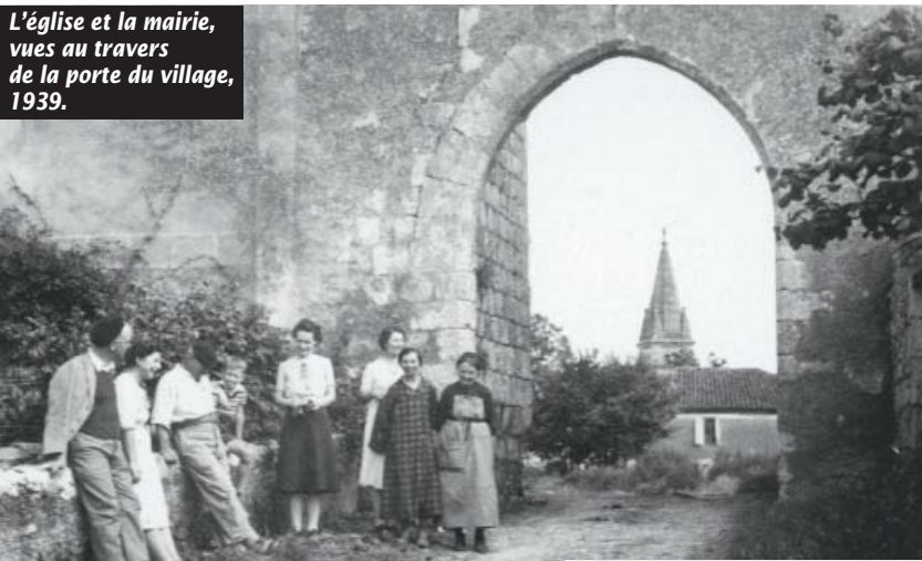
L'église et la mairie, vues au travers de la porte du village, 1939.