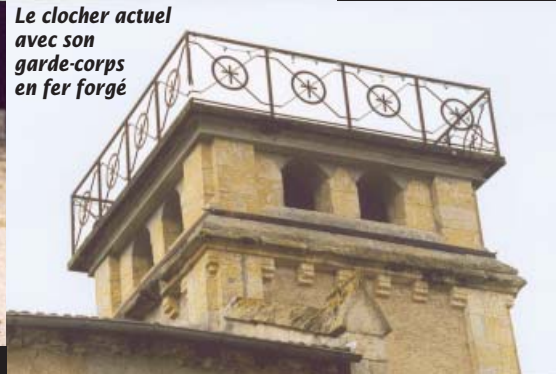
Le clocher actuel avec son garde-corps en fer forgé