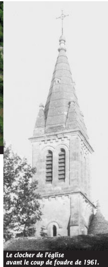
Le clocher de l'église avant le coup de foudre de 1961.