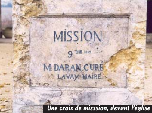
Une croix de mission, devant l'église