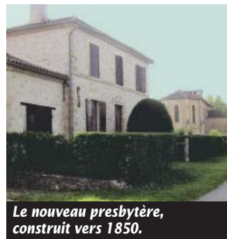
Le nouveau presbytère, construit vers 1850.

Vers 1830, le village de Maignaut conserve encore par bien des aspects sa physionomie médiévale, comme le montre l'ancien plan cadastral. En quarante ans (des années 1840 aux années 1880), les travaux vont transformer peu à peu son visage. C'est le temps où les villages se dotent de leurs premiers équipements publics (écoles et mairies), et reconstruisent leurs églises.