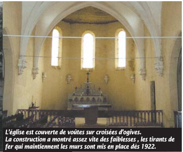
L'église est couverte de voûtes sur croisées d'ogives. La construction a montré assez vite des faiblesses, les tirants de fer qui maintiennent les murs sont mis en place dès 1922.